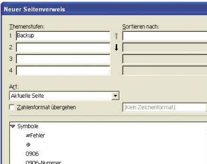
Über dieses Dialogfeld wird dem Index ein Eintrag hinzugefügt.