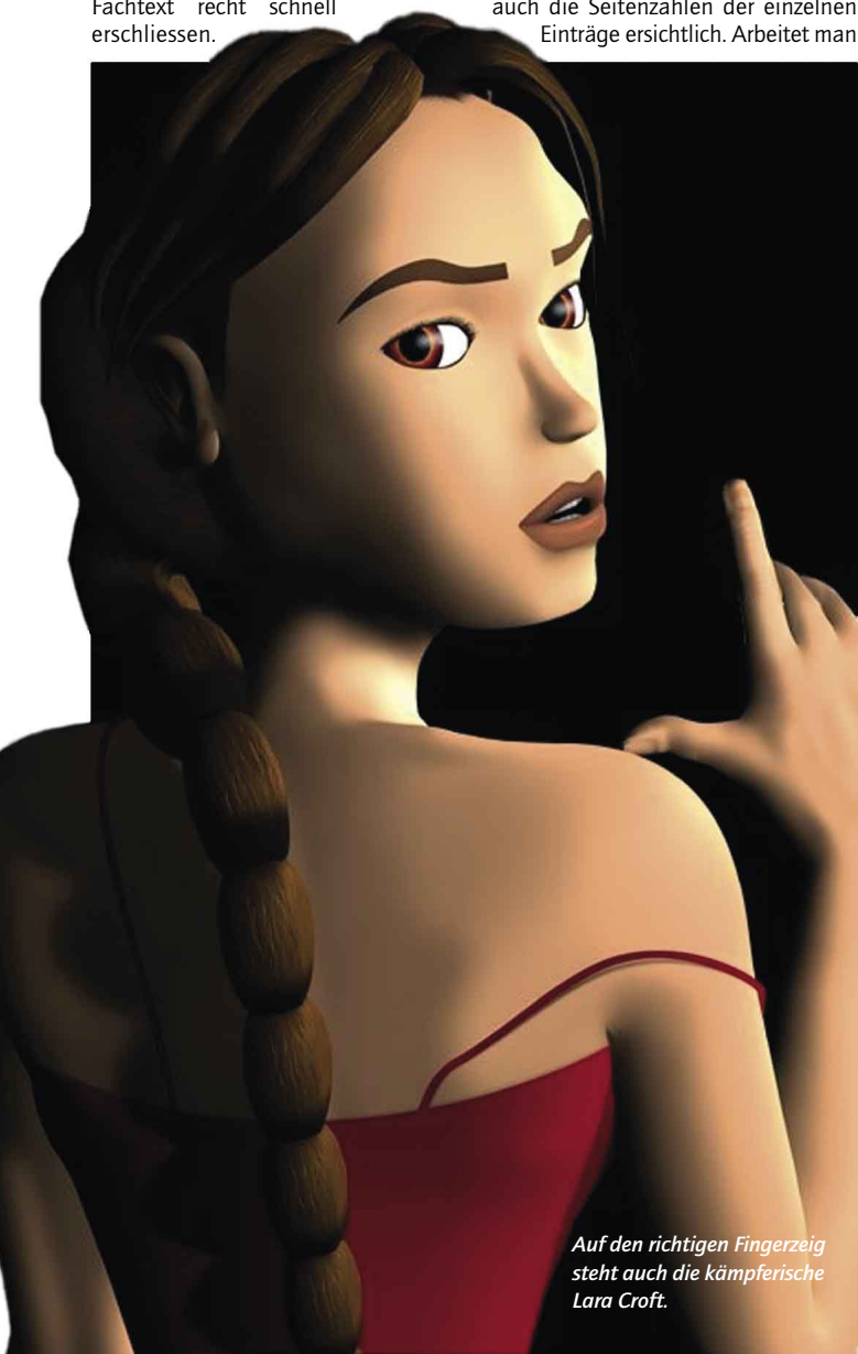
Auf den richtigen Fingerzeig steht auch die kämpferische Lara Croft.

■ Um alle Vorkommen eines Begriffs auf einen Schlag zu indizieren, bietet die Indexpalette den Befehl «Alle hinzufügen». Machen Sie davon nur bei stringent verwendeten Fachbegriffen Gebrauch, damit der Index nur auf relevante Textstellen verweist.